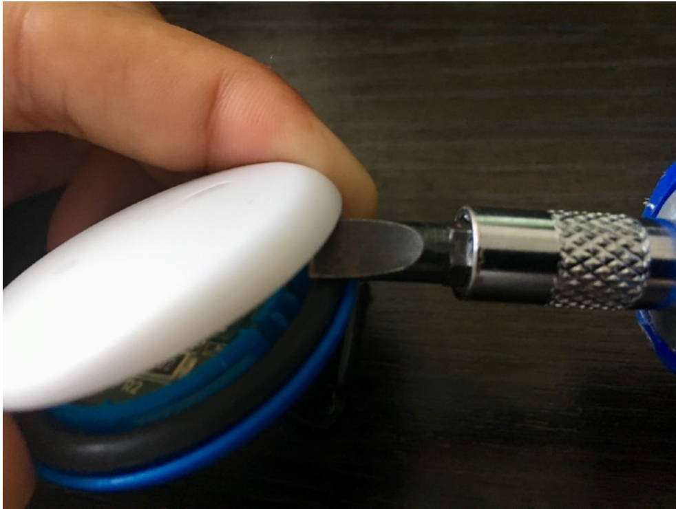
El interior de tu Helpy